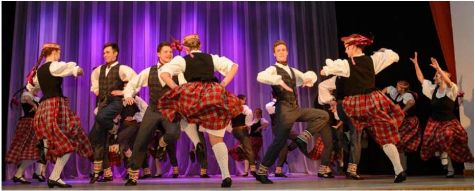
19.50 G2 Bamdad - Mashhad, Iran