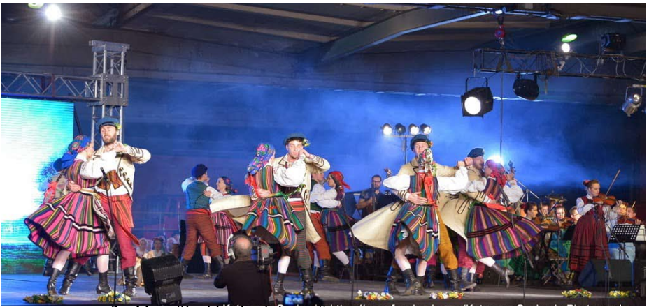
2. „Mix of highlanders' dances“

20.30 G1 Latvian folk music instrument - kokle group "BALTI" at CULTURAL AND EDUCATIONAL CENTRE of BABITE MUNICIPALITY - Babite, Latvia