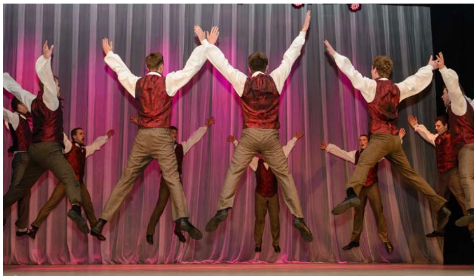
Folklore Dance Ensemble “Liksmе”, Cultural Center at Daugavpils region - Daugavpils, Latvia