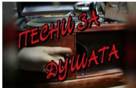
Songs for The Soul