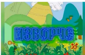
Izvorche - Spring