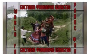
World Folklore Arts