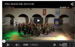
Film IV World folk 2014 HD