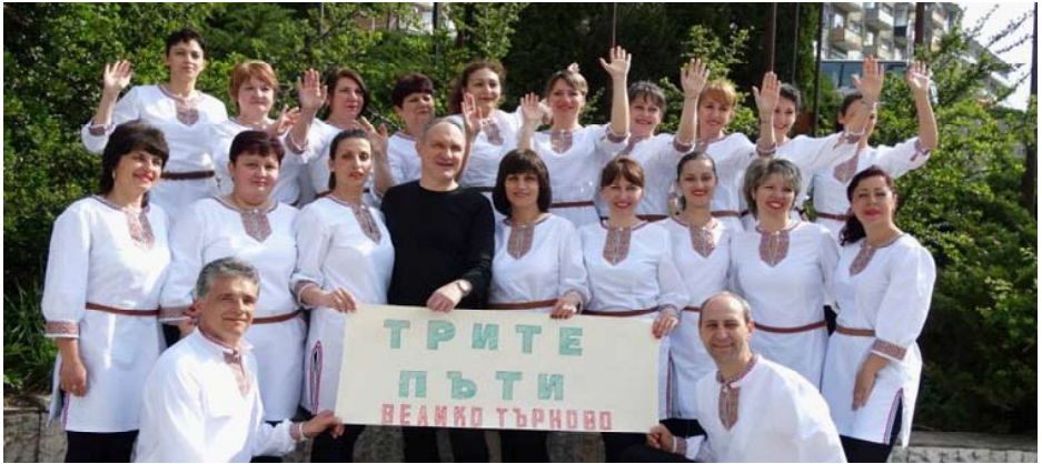
19.45 D*1 Ансамбъл „Вълчениций“ в Гимназий Вълчинец - село Вълчинец, район Кэлэраш, Молдова