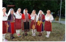
Banet distinctive art and century-old national costumes gather admirers in Kiten