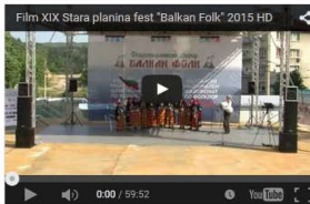
XIX Stara planina Fest - Balkan Folk 2015