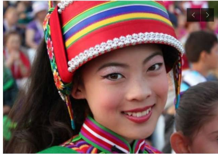
BEHIND US ARE THE MEMORY OF OUR FATHERS, IN FRONT OF US ARE THE EYES OF OUR CHILDREN!