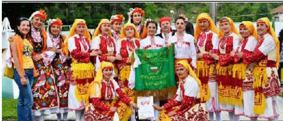
2. „Родопска китка“